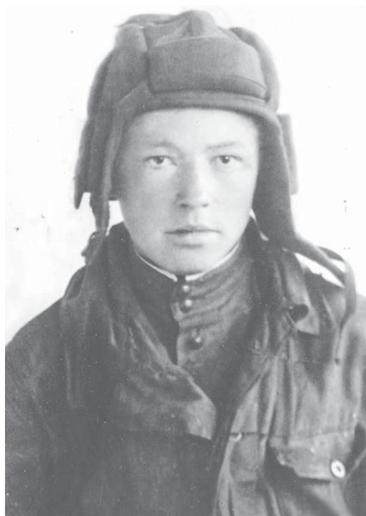
РИСУНОК – В ПАМЯТЬ О СОЛДАТЕ

победу, он чувствует, что она близко: «Нужно же нам всем вместе отпраздновать праздник победы. А час победы уже близок. Уже топчу я поганую землю своим сапогом. Уже гремят наши орудия за Одером».