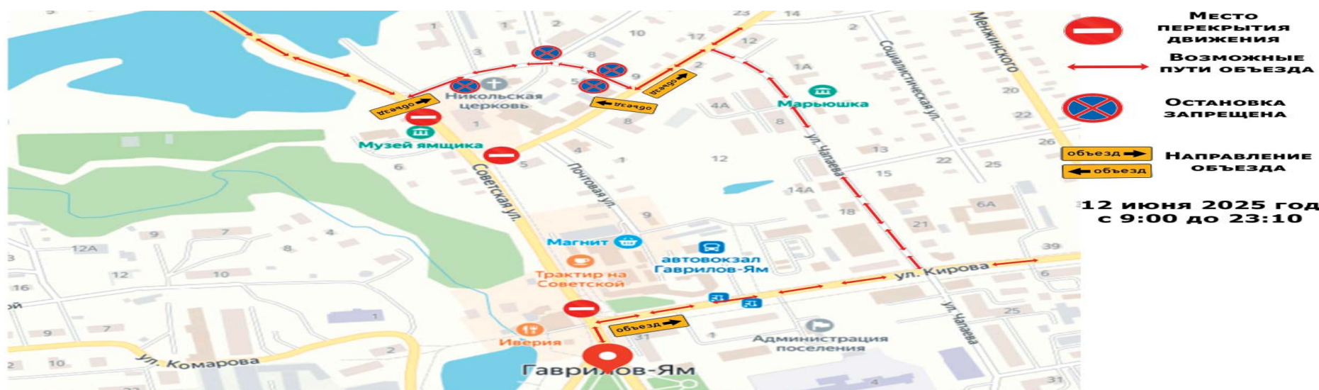
СХЕМА ОБЪЕЗДА ТРАНСПОРТНЫХ СРЕДСТВ

13.00 - Познавательные экскурсии по залам музея «10 лет музею Локалова». 17.00 Открытие выставки «100летие Гаврилов-Ямской железной дороги».