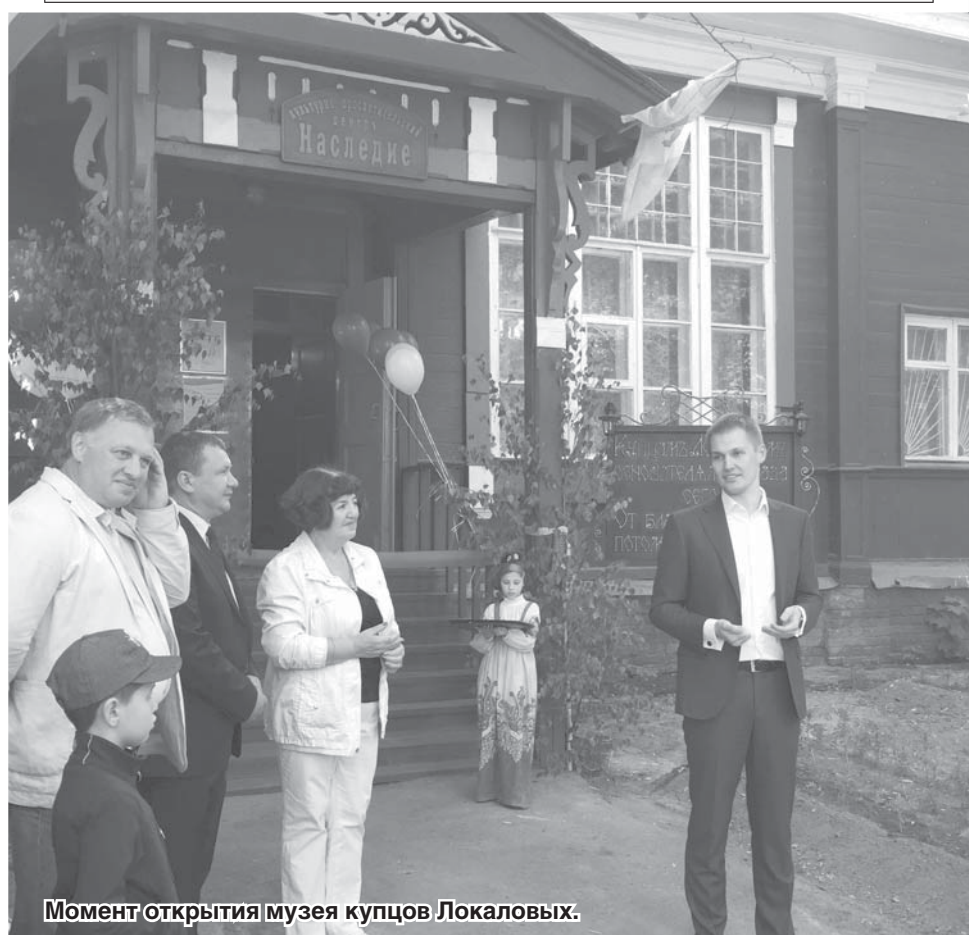
Момент открытия музея купцов Локаловых.